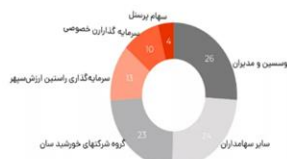
آخرین ترکیب سهامداری تپسی

افزایش شدید خریدهای اینترنتی در ایران و لزوم افزایش فعالیت شرکت‌ها و استارت‌آپ‌ها و ارائه خدمات غیرحضور با باعث شده است که دیجی کالا به عنوان یکی از بزرگترین فعالان فروش اینترنت کالا در ایران و خاورمیانه به فکر افزایش حوزه فعالیت آنلاین خود افتد. از این رو به تازگی خبر رسیده که دیجی کالا تصمیم به ارائه خدمات دلیوری و سفارش غذا آنلاین گرفته است و به صورت مستقیم رقابتی برای