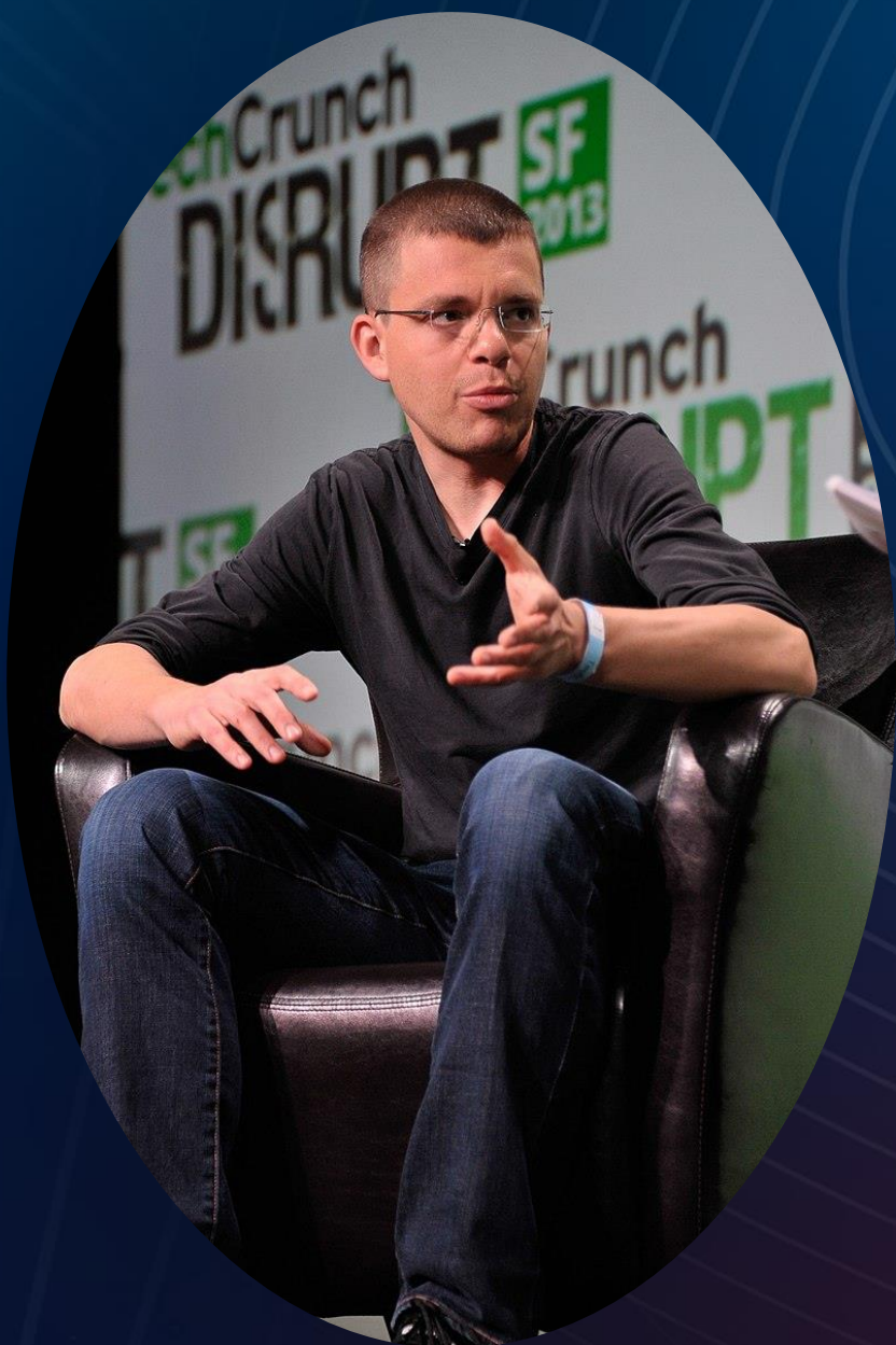
Maksymilian Rafailovych "Max" Levchin

شرکت خدمات مالی آمریکایی است، که در سال ۲۰۱۲ توسط مکس لوچین تأسیس شد. خریدهای مشتریان خرد را با وام های فوری با نرخ بهره ۰٪ تا ۳۰٪ تامین مالی می کند. Affirm مستقیماً به فروشگاه های آنلاین متصل می شود. ایده پشت آن این است که مشتری در حین پرداخت در فروشگاه آنلاین با Affirm خرید می کند، که سفارش را ثبت و پردازش می کند. Affirm تمام مبلغ را با فروشگاه تسویه می کند و وام را مستقیماً به مشتری ارائه می دهد.